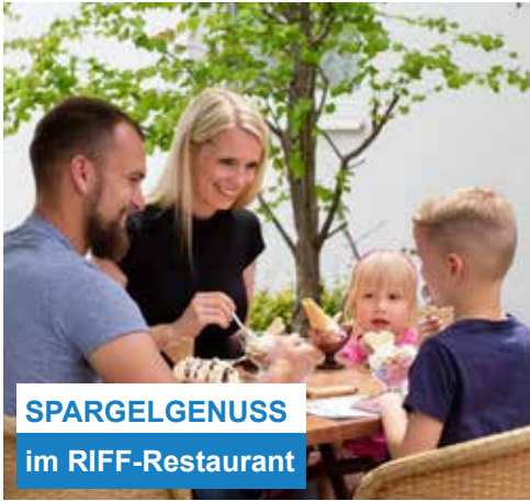
SPARGELGENUSS im RIFF-Restaurant

Wie in den letzten Jahren starten wir bereits früh in die köstliche Spargel-Saison. Unser regionaler Spargellieferant kann uns dank eigener Wärmequelle bereits im zeitigen Frühjahr mit dem beliebten Stangengemüse beliefern. Dieses Jahr möchte unsere junge Koch-Crew Sie mit ausgefallenen Spargelgerichten überraschen. Es gibt neue Kreationen dieses königlichen Gemüses.