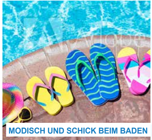
MODISCH UND SCHICK BEIM BADEN

In unserem RIFF-Shop gibt es für Jung und Alt Schickes zum Baden und für den Strand. Neben attraktiven Bademoden für alle, gibt es (fast) alles was Kind, Frau und Mann zum Schwimmen und Baden noch so benötigt.